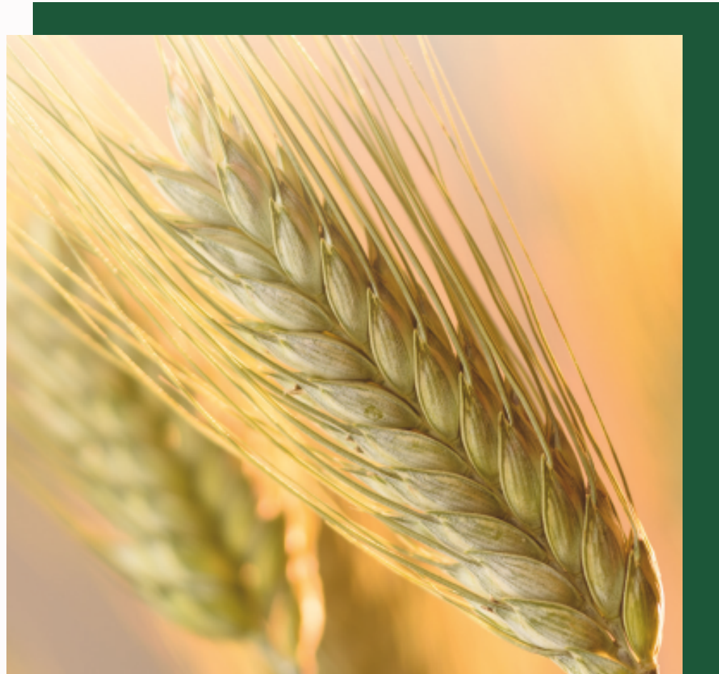
Cietie kvieši, ziemas