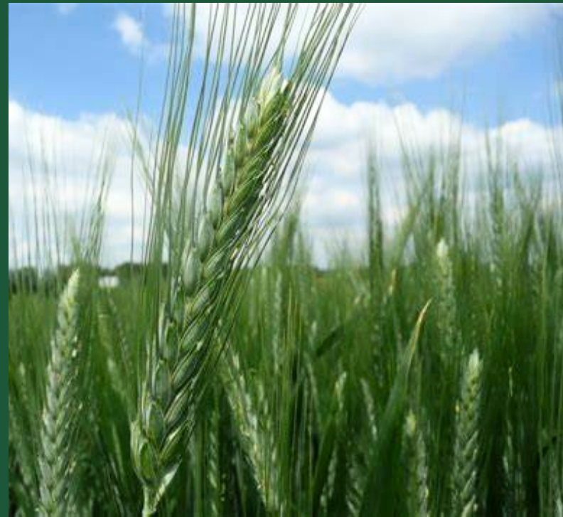
Cietie kvieši, ziemas