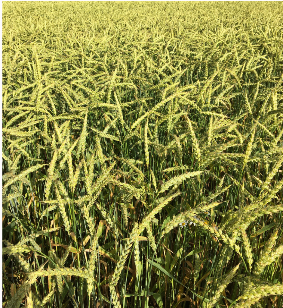
Latvijā selekcionēta šķirne, AREI