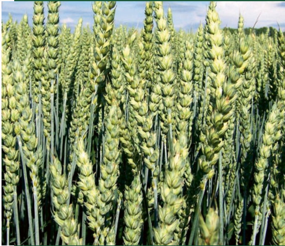
Latvijā selekcionēta šķirne, AREI