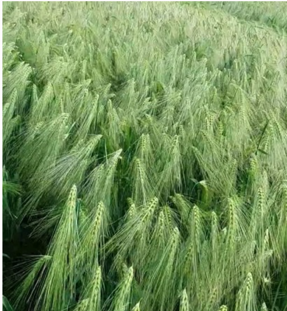
Ziemas mieži, nekodināti